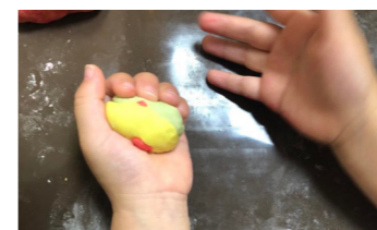
材料をまぜてよくこねます