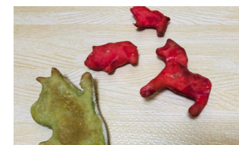
トースターで焼くと、固くなります（低温で15～20分）