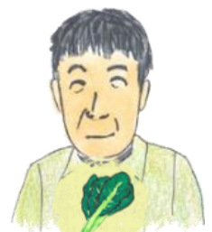
たかはしさん こまつな