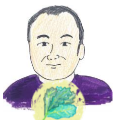
ひらやまさん ほうれんそう