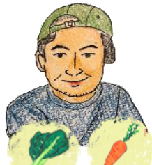
たなかさん こまつな・にんじん