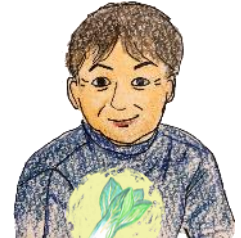
せりかわさん チンゲンサイ