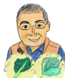
こぼりさん こまつな・ほうれんそう