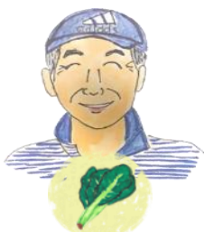
しのぎきさん こまつな