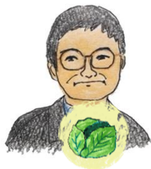
おかのさん キャベツ