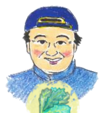
すがさわさん ほうれんそう