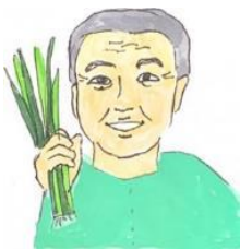
ほりずみさん こねぎ