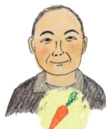
みずさん にんじん