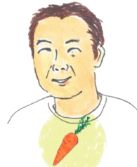
すぎもとさん にんじん