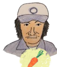
こしかわさん にんじん