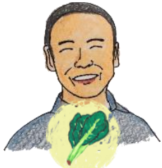
きたじまさん こまつな